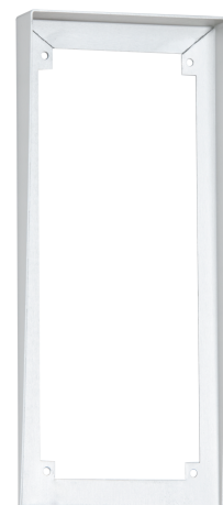
Passo/Auvent 1-9-120 (Option)