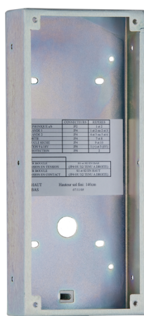
Passo/UP 1-9-120 (Inclus)