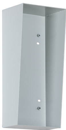
Passo/AP 1-9-120 (Option)

Hauteur de montage standard 140 cm du sol fini à l'axe