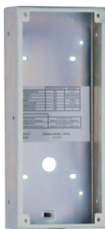
Passo/UP 1-9-120 (Inclus)