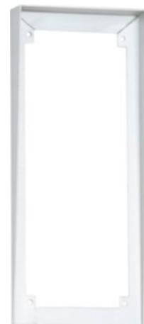
Passo/Auvent 1-9-120 (Option)