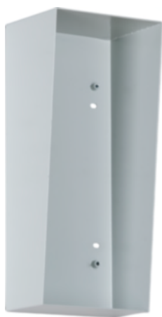
Passo/AP 1-9-120 (Option)